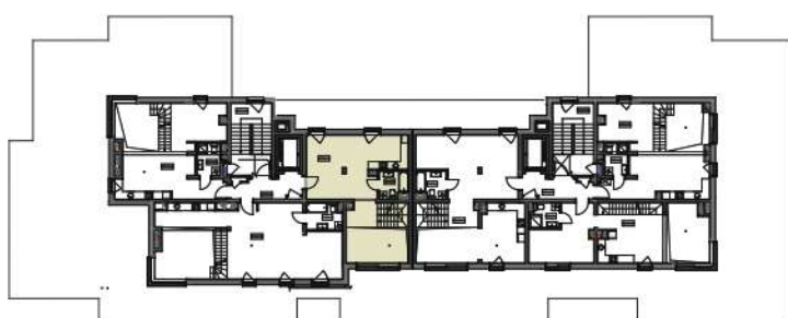
plan sytuacyjny z lokalizacją apartamentu